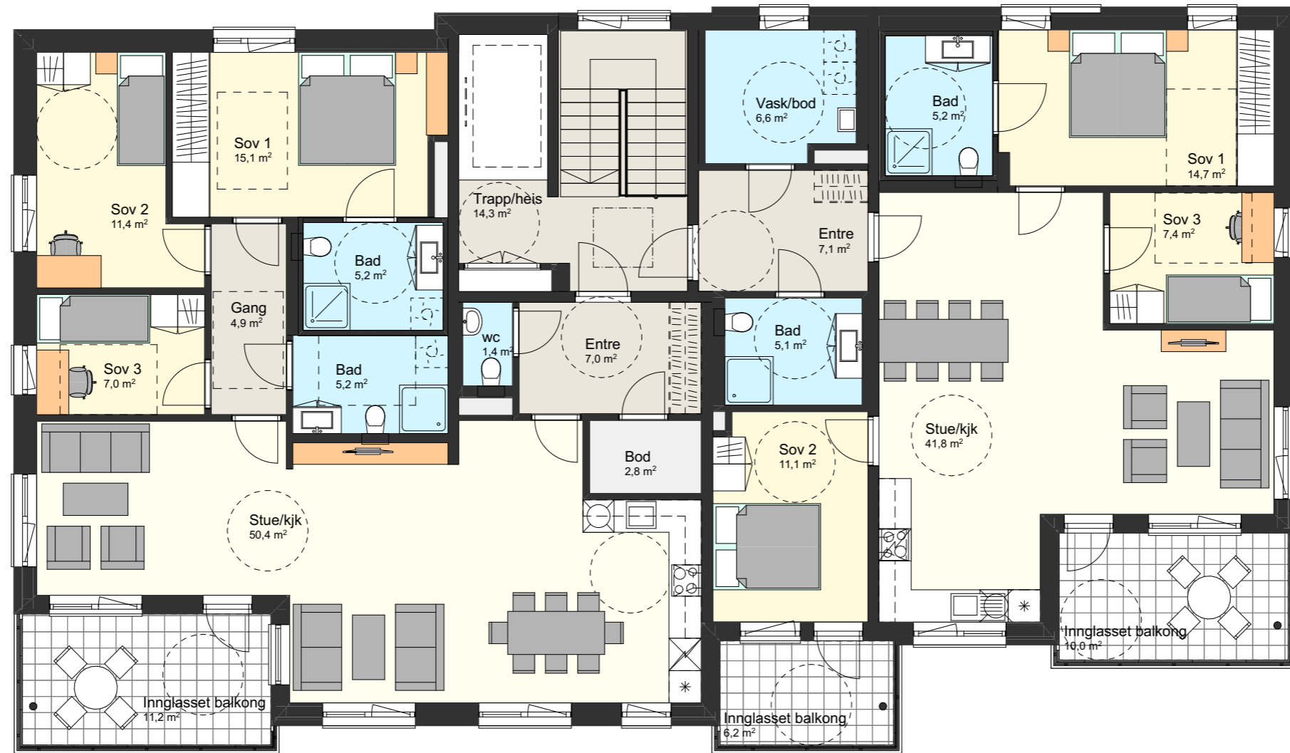
Leilighet BBB4 - 402 117,8 m 2