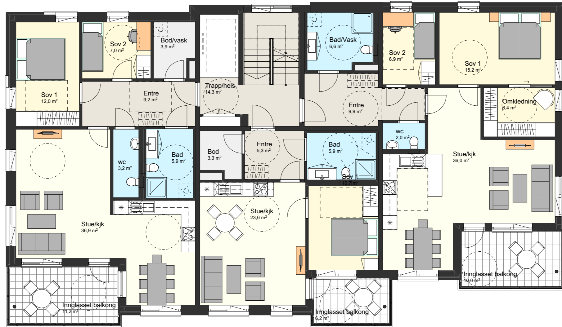
Leilighet BBB4 - 203 82,8 m 2