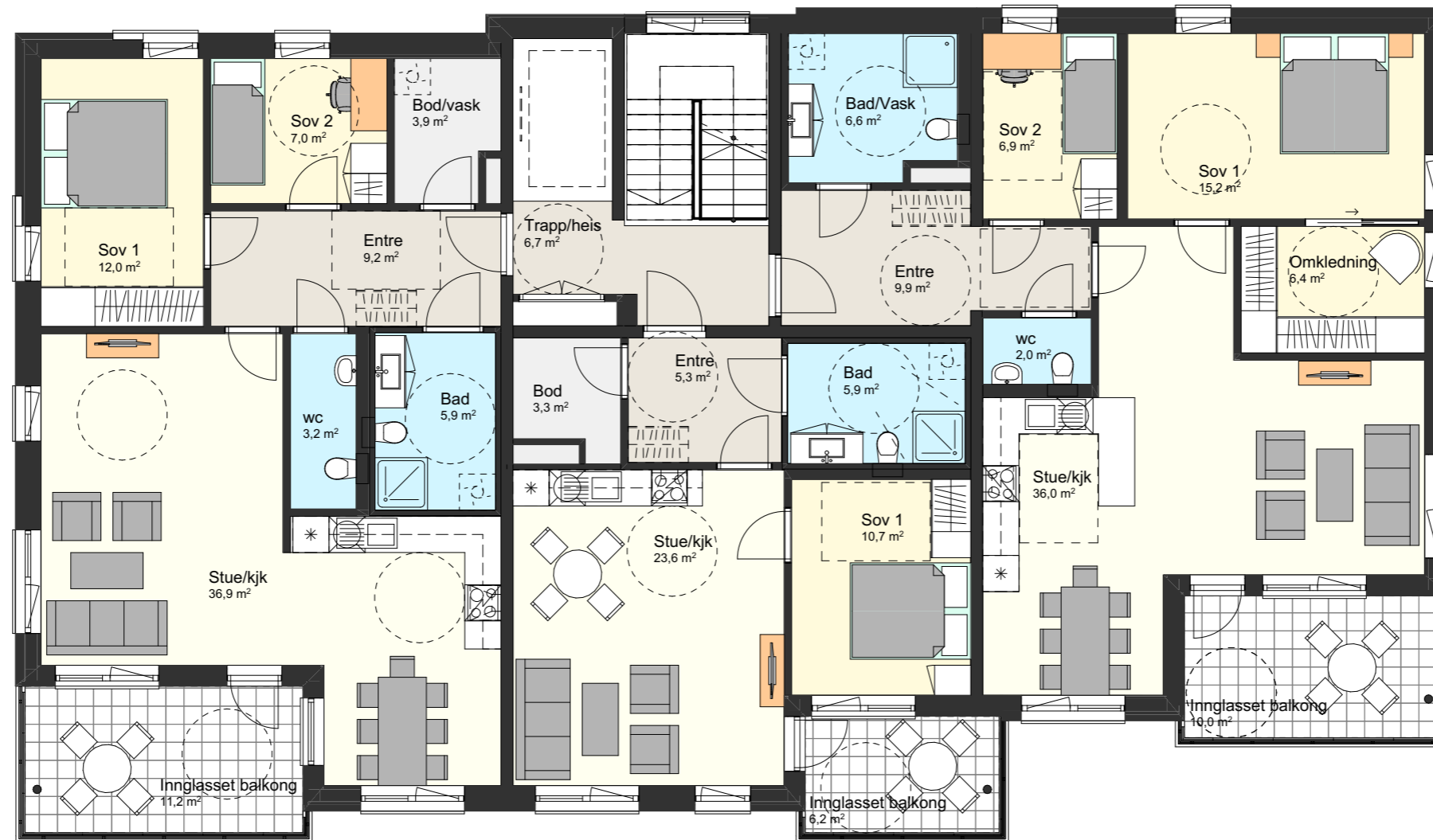
Leilighet BBB4 - 303 82,8 m 2